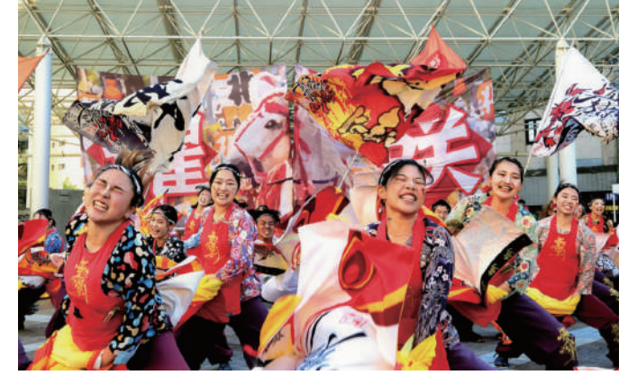
YOSAKOIさせば祭り

武蔵野美術大学油絵科卒業後、(株)ピックルスコオペレーションに入社。商品開発とデザインを担当。震災直後の「青森ねぶた祭」を訪れた際、地元の人々が心の底から楽しんでいる様子を見てお祭りの持つ力に気付く。同時に多くのお祭りが課題を抱えていることを知り、全国各地のお祭りを多面的にサポートする会社「株式会社オマツリジャパン」を創業。「青森ねぶた祭」や「岸和田だんじり祭」をはじめ、大小問わず数多くの地域の祭りへの支援実績を持つ。2児の母。