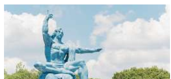
平和公園 (イメージ)