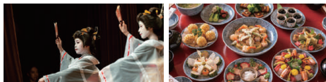
長崎検番 (イメージ)