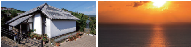
ド・ロ神父記念館 (イメージ)