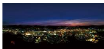
稲佐山からの夜景 (イメージ)