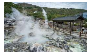
雲仙地獄 (イメージ)