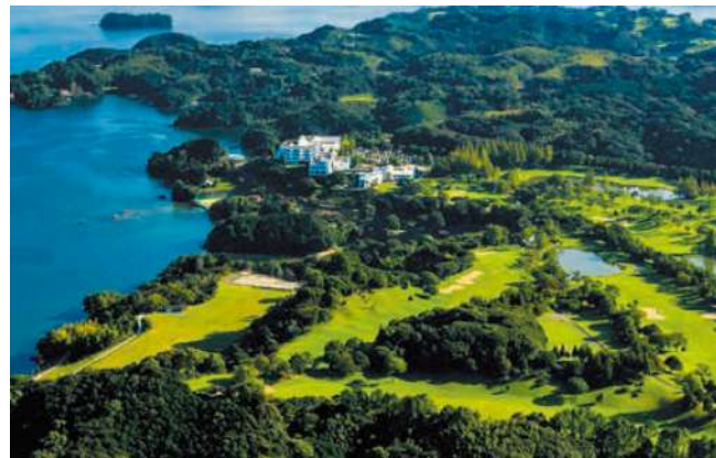
パサージュ琴海アイランドゴルフクラブ (イメージ)