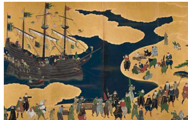
南蛮人來朝之図(長崎歴史文化博物館収蔵)