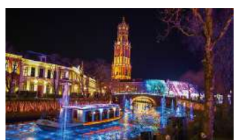
ハウステンボス(イメージ)