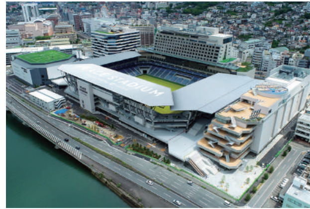
長崎スタジアムシティ(2024年10月開業)

分科会においては、長崎地域や全国で展開されるスポーツイベントなどを参考に、スポーツによる観光まちづくりについて考えます。