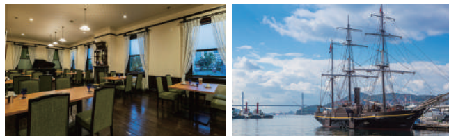
長崎内外倶楽部 (イメージ)