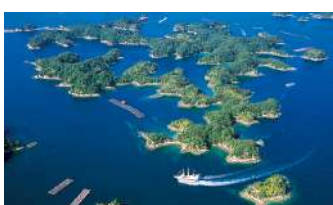
九十九島(イメージ)

日本最大のテーマパーク「ハウステンボス」では光り輝くイルミネーションがみどころ。園内散策やアトラクションも体感いただけます。絶景九十九島、佐世保の歴史、佐世保バーガーと盛り沢山!