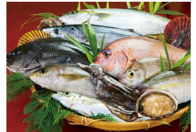
長崎県の新鮮な魚

分科会においては、観光との連携強化による地場産業の活性化や身近な地域資源の活用への取り組みなどを紹介し、「食」を活用した観光まちづくりについて考えます。