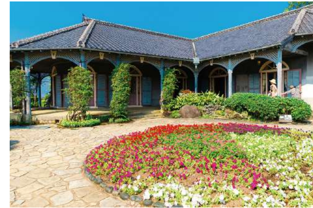
グラバー園(イメージ)