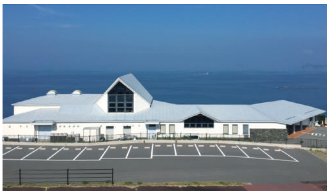
長崎市遠藤周作文学館 (イメージ)