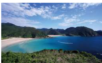
高浜海水浴場(イメージ)

長崎県は離島の数がNO.1として知られています。ジェットfoilを利用して五島列島の福江島を訪れ、美しい海岸の景色や、海の幸、山の幸を五感でお楽しみいただけます。